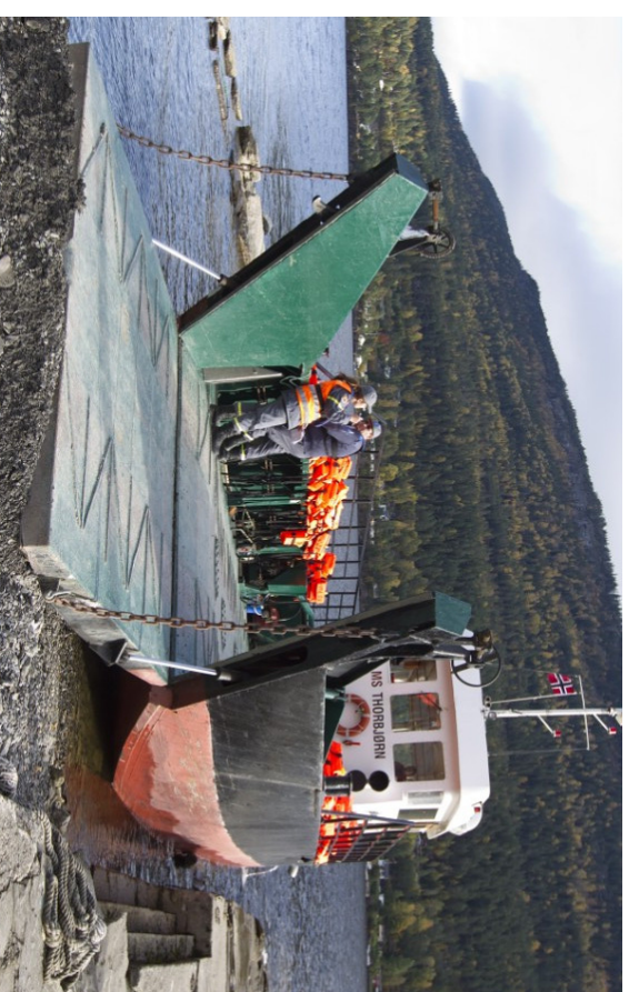
Utrøya-fergen MS Thorbjørn