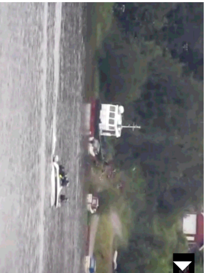
Videoopptak av politibåt nr. 2 idet den passerer M/S Thorbjørn.

Mindre enn et minutt etter overføring til båt nr. 2, viser amatørvideoen at BT passerer MS Thorbjørn på rundt 100 meters avstand. 32 På dette tidspunkt sto ferga fortsatt på grunn. Jeg ønsker å dele en avsluttende tanke når det gjelder den potensielle rollen som øyas ferge kunne ha spilt. Ifølge Anders Behring Breiviks eget vitnesbyrd "...hadde han planer om å drepe mannskapet på ferja fordi han regnet det som sikkert at båten ville bli brukt til å frakte politistyrker til Utøya." 33 Han sa at "Det var en direkte trussel mot oppdraget..." 34 Men "Breivik forklarte at han lot være å skyte dem fordi han ikke hadde noen indikasjon på at de var tilknyttet Arbeiderpartiet. De var dermed 'sivile' i hans øyne." 35 Jeg synes det er ganske ironisk at selv om Breivik gjorde en prinsipielt taktisk feil ved å la